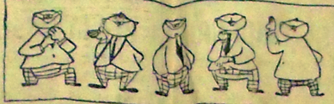
Instruo, herbol. Vale la pena. Lo peso bien. ¡Pecho... respira! ¡Vá! que coas!